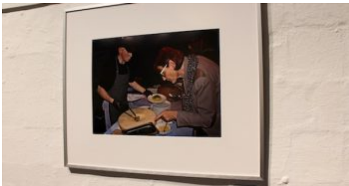
Ausstellung „Kommunikation“ der Fotogruppe Fokus. „Auswahlberatung“ von Wolfgang Otto.