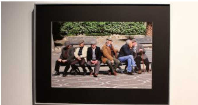
Ausstellung „Kommunikation“ der Fotogruppe Fokus. „Stille Post“ von Harald Gronemeyer.