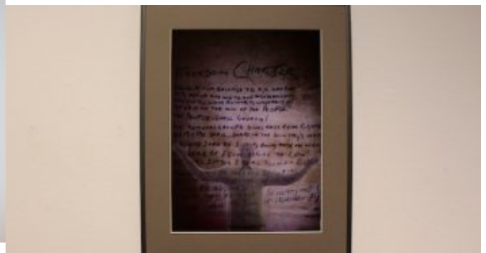
Ausstellung „Kommunikation“ der Fotogruppe Fokus. „Freedom Charter“ von Detlef Nyszkiewicz.