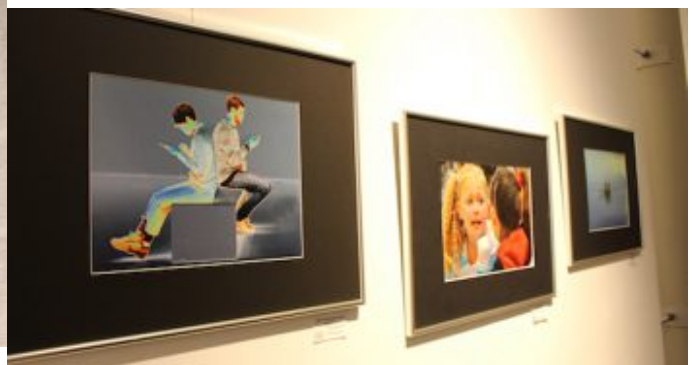
Ausstellung „Kommunikation“ der Fotogruppe Fokus. Bilder von Dagmar Herfurth, im Vordergrund „Kommunikation invers“.