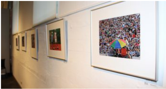
Ausstellung „Kommunikation“ der Fotogruppe Fokus. Bilder von Wolfgang Otto, im Vordergrund „Karaoke - Reaktionen“.