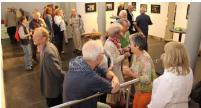
Ausstellung „Kommunikation“ der Fotogruppe Fokus. Gäste kommunizieren bei der Vernissage.