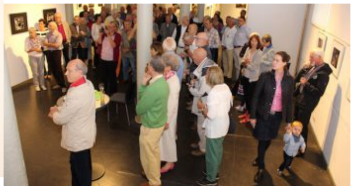
Ausstellung „Kommunikation“ der Fotogruppe Fokus. Gäste kommunizieren bei der Vernissage.