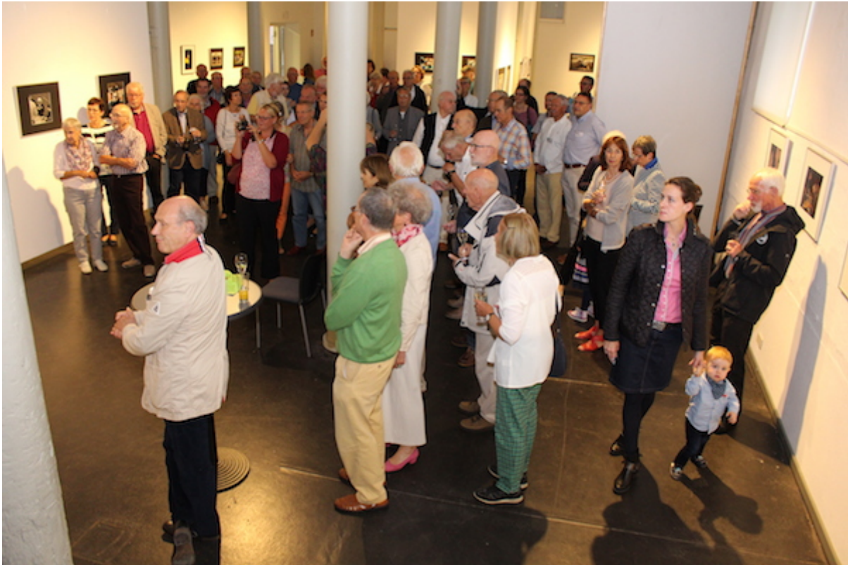
Ausstellung „Kommunikation“ der Fotogruppe Fokus. Gäste kommunizieren bei der Vernissage.