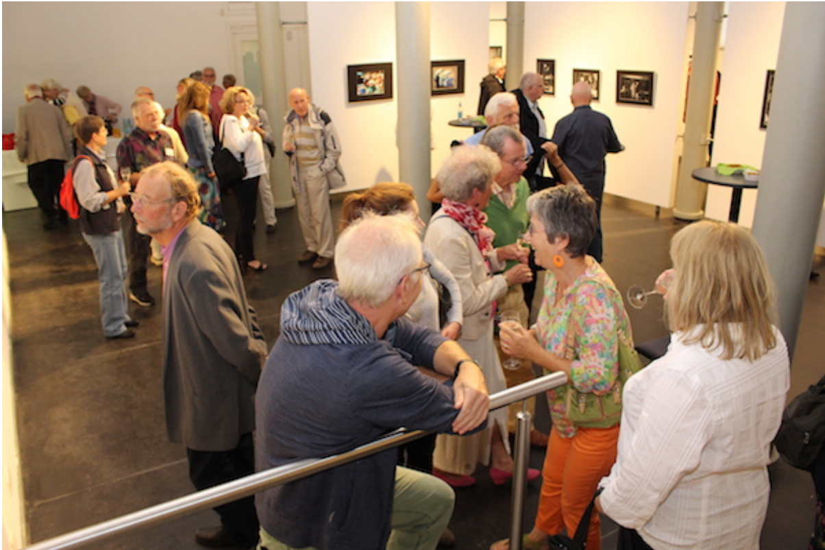
Ausstellung „Kommunikation“ der Fotogruppe Fokus. Gäste kommunizieren bei der Vernissage.