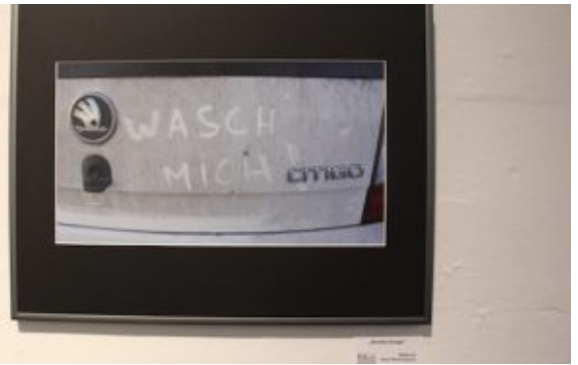
Ausstellung „Kommunikation“ der Fotogruppe Fokus. „Schmutzfink“ von Angelika Pego-Nyszkiewicz.