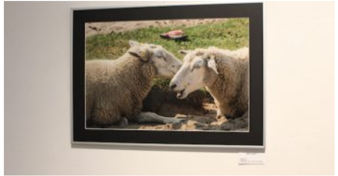
Ausstellung „Kommunikation“ der Fotogruppe Fokus. „Mmh-määh“ von Wolf-Dieter Hynding.